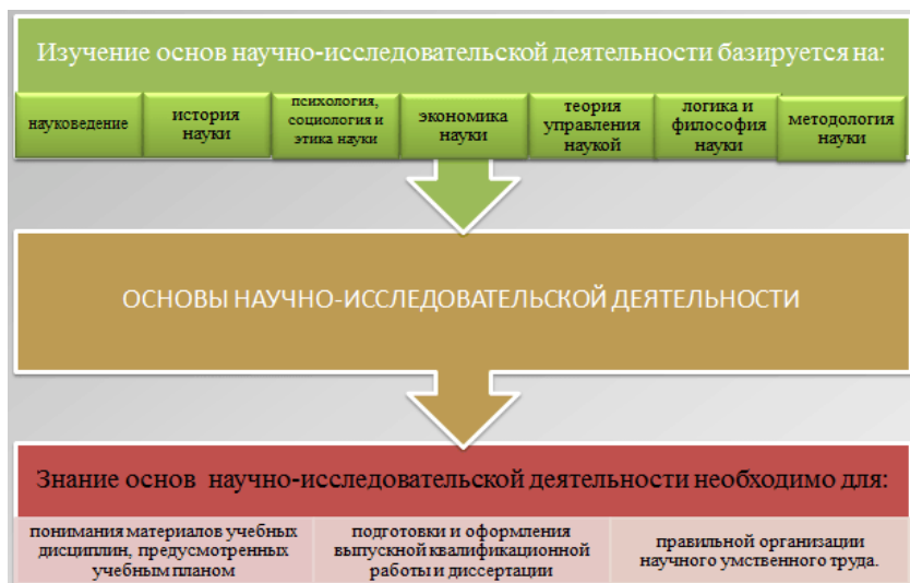
Рисунок 2 – Связь курса с другими дисциплинами